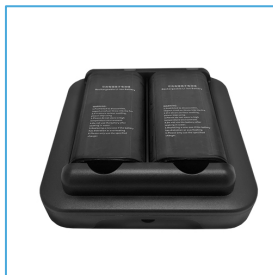
Cargador de baterías Pistol Grip DC0509-PG-CR