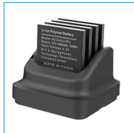
Cuna de carga de 4 ranuras DC0509-MC