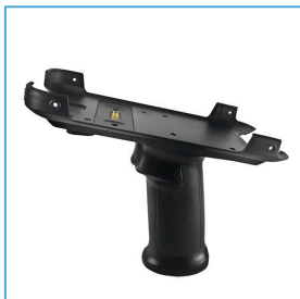
Pistol Grip DC0509-PG