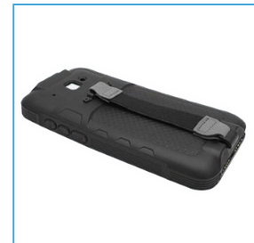
Protector de goma con correa de mano DC0509-BS